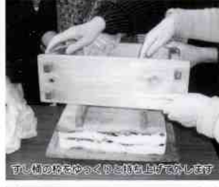
平子連の皆さんが、大平と岩国ずしを丁寧に詰めています。

ひと昔前では、結なく、それでいて 婚式や法事など冠婚 葬祭時には必ず出さ れていた「大平」「岩 国ずし」。 今では、家庭料理 でほとんど見かけな くなりました。 平田地区社会福祉 協議会では、この伝 統の郷土料理を取り 戻そうと、3月15日 (日)、平田供用会館 で調理・試食会を行 いました。 調理は平田婦人会、 山中婦人会、平子連 の皆さんにしていた だき、試食は平田地 区社協の37名の方に していただきました。 押しずしは一般的 に硬いとの定評があ りますが、決して硬 くなく、それでいて 型崩れしない適度の ものでした。上に乗 せた具の味が口に合 っていました。 かつては酸味も好 んで食したと伝えら れるだけあって、岩 国の主食の玉穂とい えるものでした。 大平は鶏肉のエキ スが汁にしみこみ、 里芋やにんじんの味 付けも絶妙でした。 野菜がふんだんに 入っていることから 健康食としても非常 に良いものだといえ ます。 岩国ずしや大平作 りが若い人へと伝承 し、子や孫へと伝承 されんことを期待す りますが、決して硬 くなく、それでいて 型崩れしない適度の ものでした。上に乗 せた具の味が口に合 っていました。