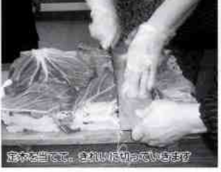
配膳を当てて、きれいに切られています。