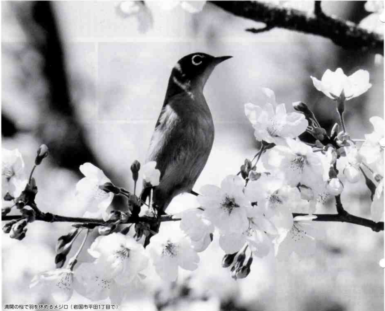
満開の桜で羽を休めるメジロ(岩国市平田1丁目で)

発行所 平田地区社会福祉協議会 ひらた新聞編集部 (岩国市平田出張所内) 岩国市平田3丁目22-18 印刷所 フジ美術印刷機 岩国市今津町2丁目2-52