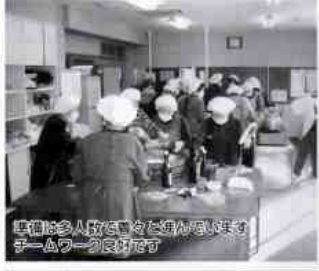
準備は多人で行って、大平と岩国ずしを丁寧に詰めています。