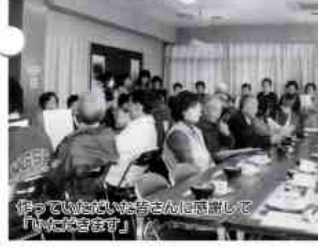
作っていただいた皆さんに感謝して「いただきます」