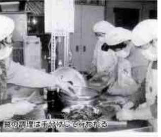
大平の調理は手分けして行われる。