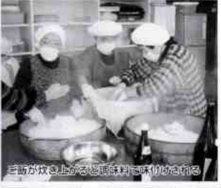
大平の炊き上がり、大平と岩国ずしを丁寧に詰めています。