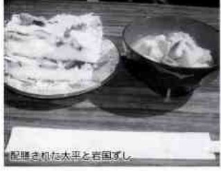
配膳された大平と岩国ずし。